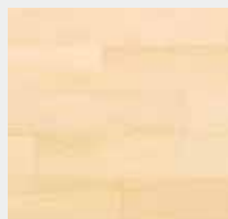
Sélect et Meilleur